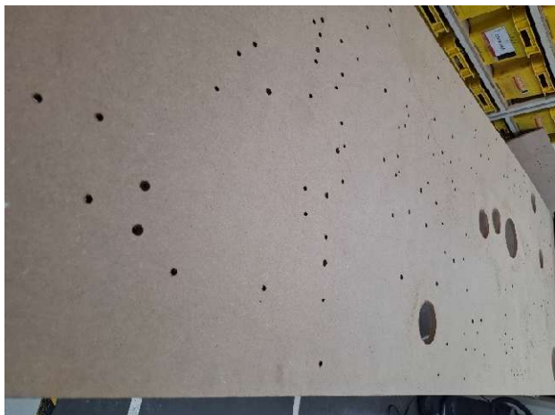
1 - Chapa em MDF