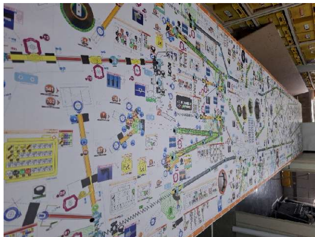
2 - Lona de impressão