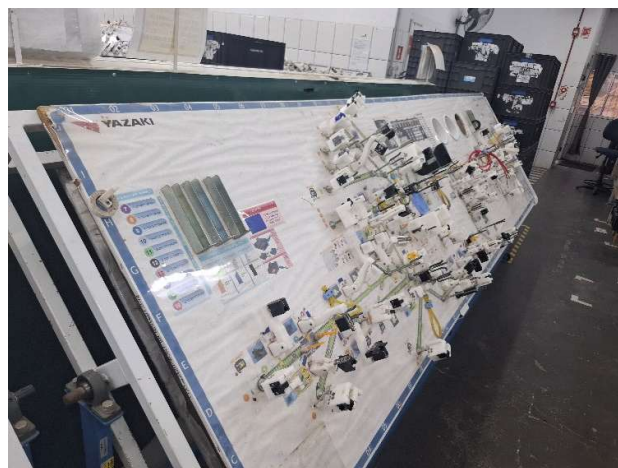
6 - Painel finalizado